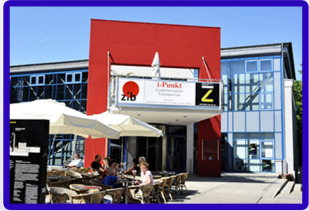
zib - Zentrum für Information und Bildung