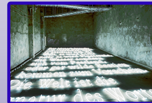
Zentrum für Internationale Lichtkunst im Ankerpunkt Lindenbrauerei