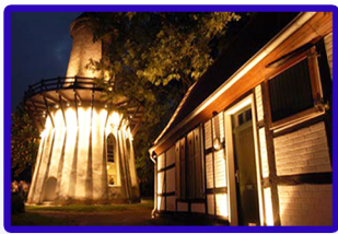
ehem. Salinenpumpwerk Friedrichsborn