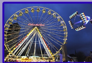
Kirmes in Unna