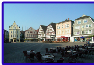
Alter Markt in der Unna Innenstadt