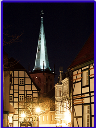
Unna bei Nacht