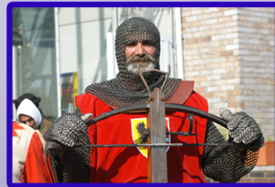
Un(n)a Festa Italiana mit Armbrustschützen aus Unnas Partnerstadt Pisa