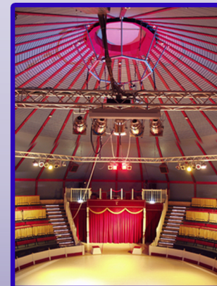
Zirkus Travados im Kurpark Unna