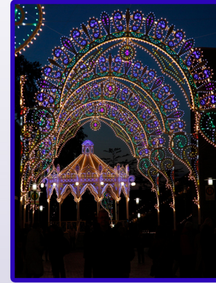
Un(n)a Festa Italiana