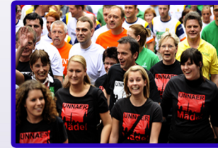
AOK Firmenlauf Unna