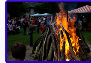
Mittsommernachtsfest im Kurpark Unna

Und wenn das Wetter mal nicht mitspielt, lädt die Stadthalle mit ihrem großen Angebot zu Theater, Konzerten oder Kabarett ein. Oder man besucht das Kulturzentrum in der Lindenbrauerei. Einst Braustätte des beliebten Gerstensaftes, heute Kulturgebräu ganz eigener Mixtur mit Musik und Kabarett, Partys und vielen anderen Angeboten. Zugleich ist sie Ankerpunkt auf der Route Industriekultur die quer durch das Ruhrgebiet führt. In ihren Kellergewölben finden Sie das Zentrum für internationale Lichtkunst mit festen oder Wechselausstellungen namhafter Künstler. Zum Shoppen lädt die Einkaufsmeile mit ihren Seitenstraßen nach dem Motto: „gibt's nicht? – gibt's nicht!“ ein. Hier findet der Kunde ein umfassendes, abwechslungsreiches sowie anspruchsvolles Warenangebot. Auf den Geschmack gekommen? Mehr über unsere interessante Stadt erfahren Sie im i-Punkt im zib oder unter www.unna.de