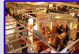
Messen in der Stadthalle Unna