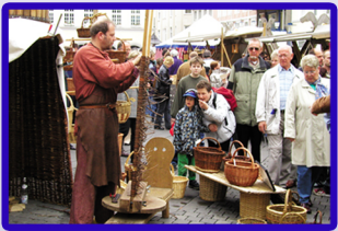
Westfalenmarkt in der Unnaer City