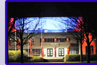
Stadthalle Unna bei Nacht