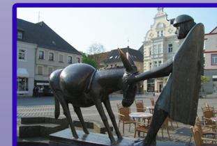
Eselbrunnen - Alter Markt